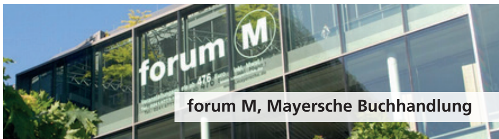
forum M, Mayersche Buchhandlung

Wir danken allen Teilnehmerinnen und Teilnehmern herzlich für ihr Engagement und den Sponsoren für die freundliche Unterstützung!